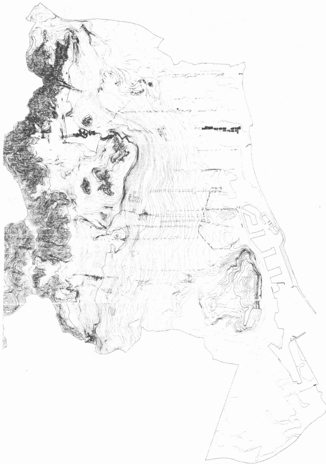
Figura 2. Barcelona. Interpretació de la forma del lloc urbà: el relleu, els nuclis històrics, les traces singulars i els parcs urbans