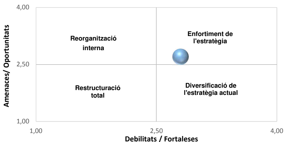
Figura 2. Resultat de l'anàlisi DAFO segons les puntuacions finals de les taules 1 i 2.

Els resultats es presenten en forma de gràfic (Fig. 2). La posició a seguir dins l'estratègia del LET en aquest gràfic ve llavors determinada per les potencialitats del centre, combinacions de fortaleses i oportunitats (FO) que assenyalen les línies d'acció més prometedores per l'organització, i les limitacions determinades per la combinació de debilitats i amenaces (DA). El resultat de l'anàlisi ens col·loca clarament en la regió d' Enfortiment de l'estratègia actual , cosa que interpretem com que cal continuar reforçant l'estratègia i les línies de treball de les entitats participants que sustenten la creació del LET (IERMB i CREAM).